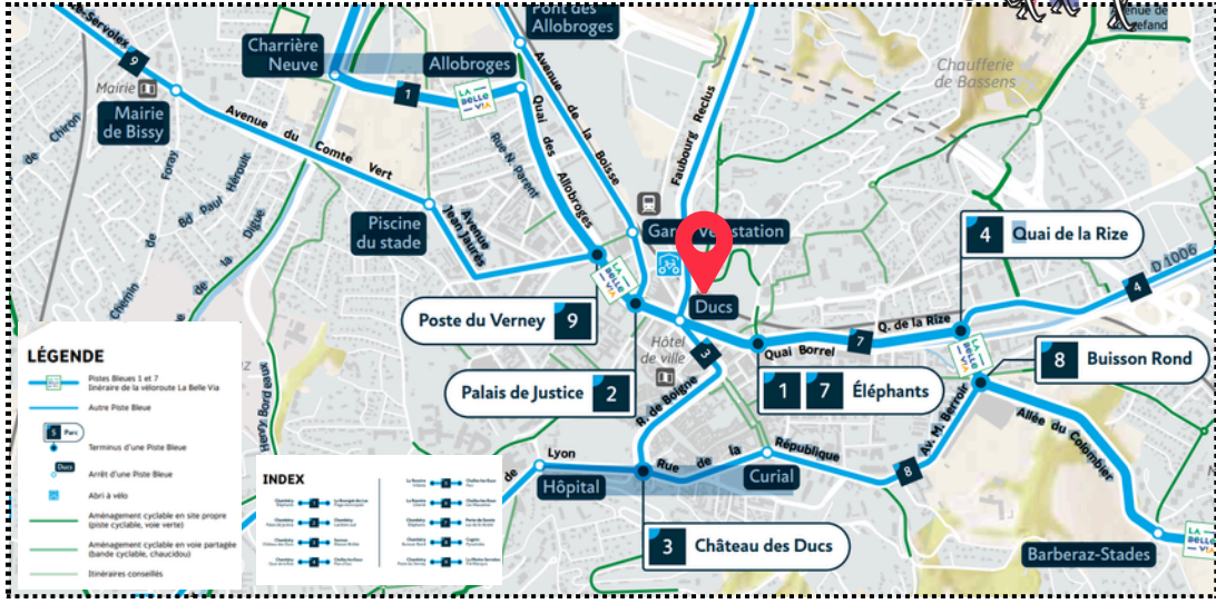
Plan des aménagements cyclables de Grand Chambéry

Des trajets souvent plus courts qu'on ne l'imagine !